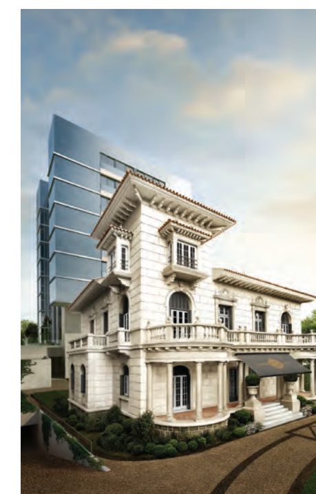
Paço Santo Inácio