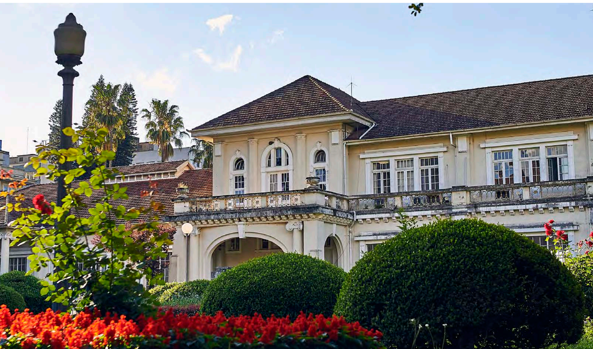
JARDINS DO DMAE