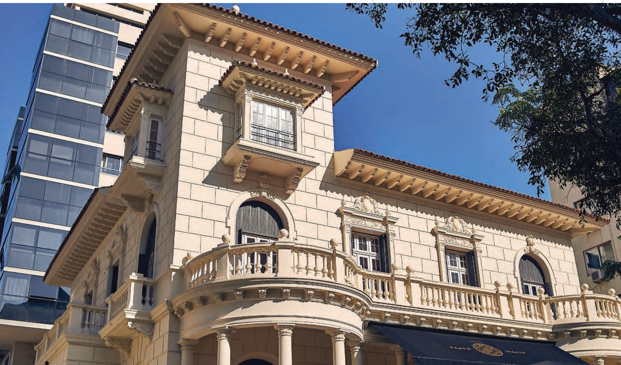
PAÇO SANTO INÁCIO