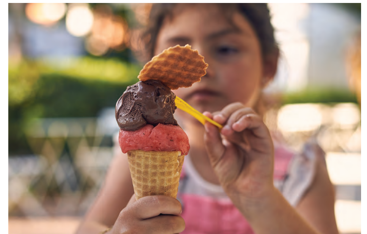
JUST COLD CREAMERY

O Moinhos é um bairro que muda para permanecer o mesmo: agradável, bonito e diversificado. Cheio de histórias. E futuros.