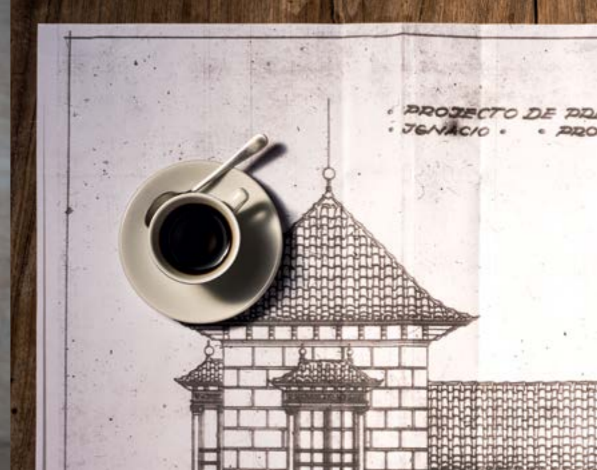
Foto ilustrativa do futuro café.