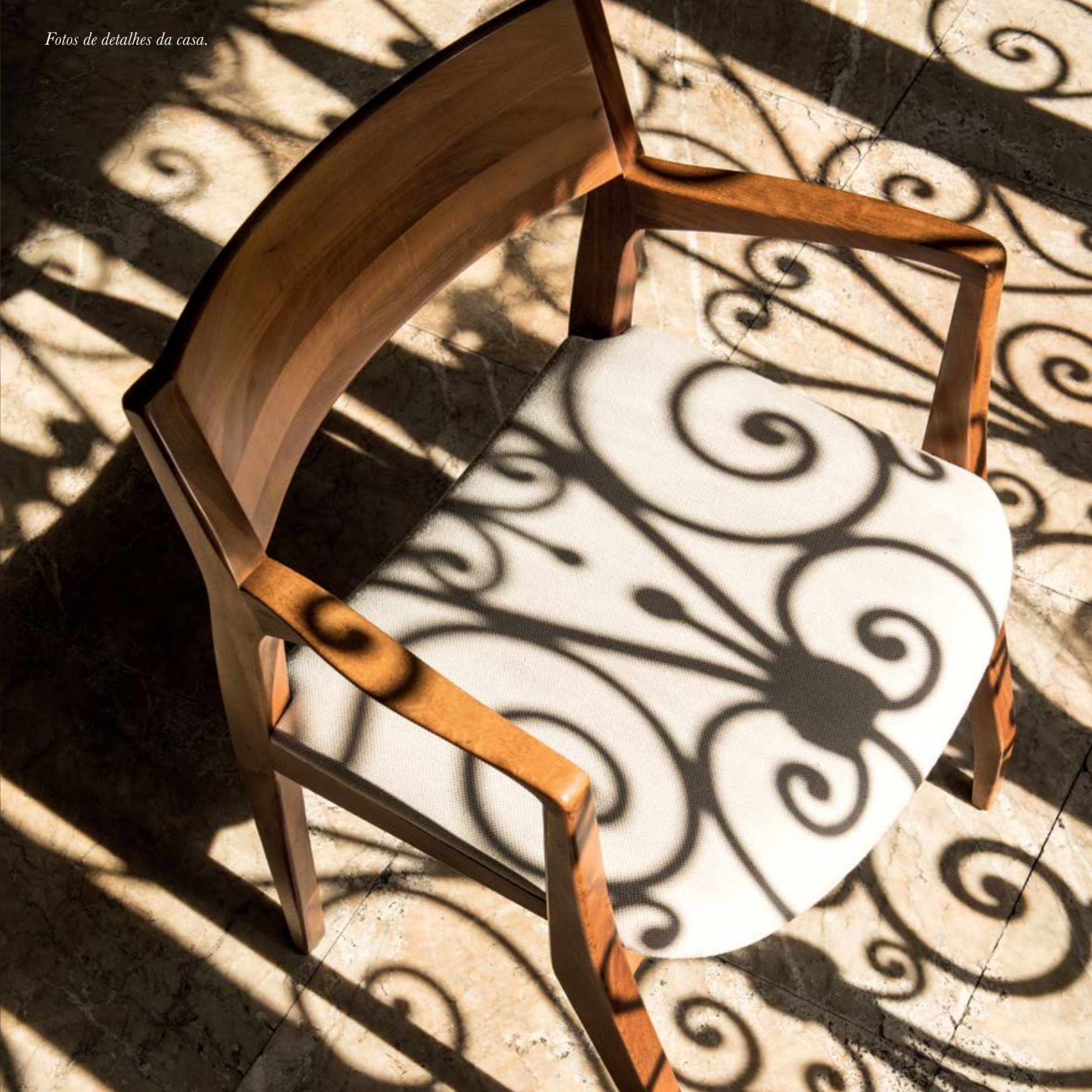
Fotos de detalhes da casa.