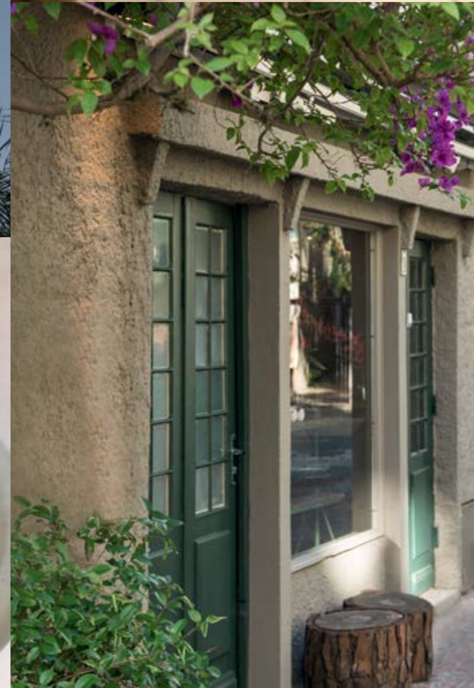
Fotos do bairro Moinhos de Vento.