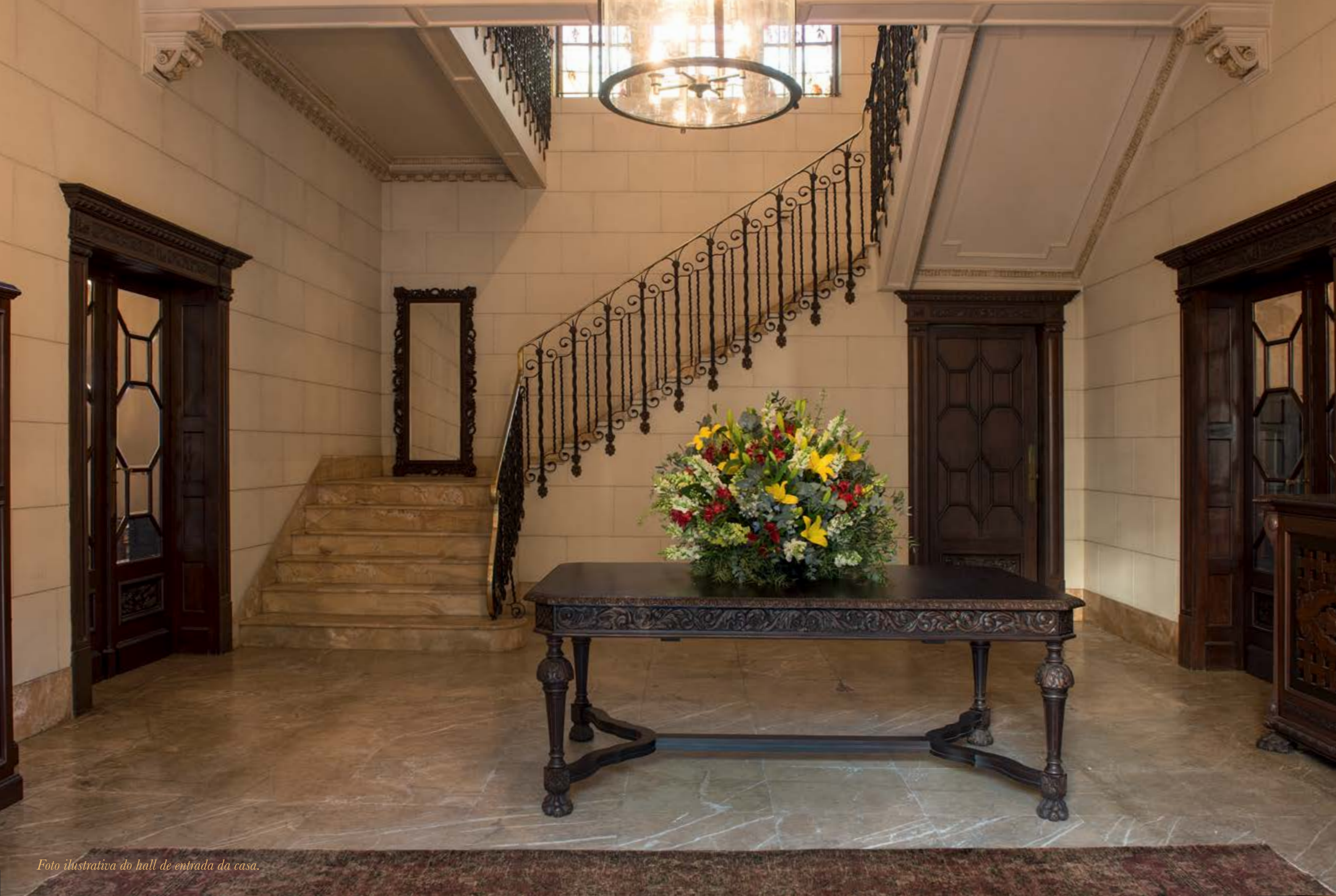
Foto ilustrativa do hall de entrada da casa.