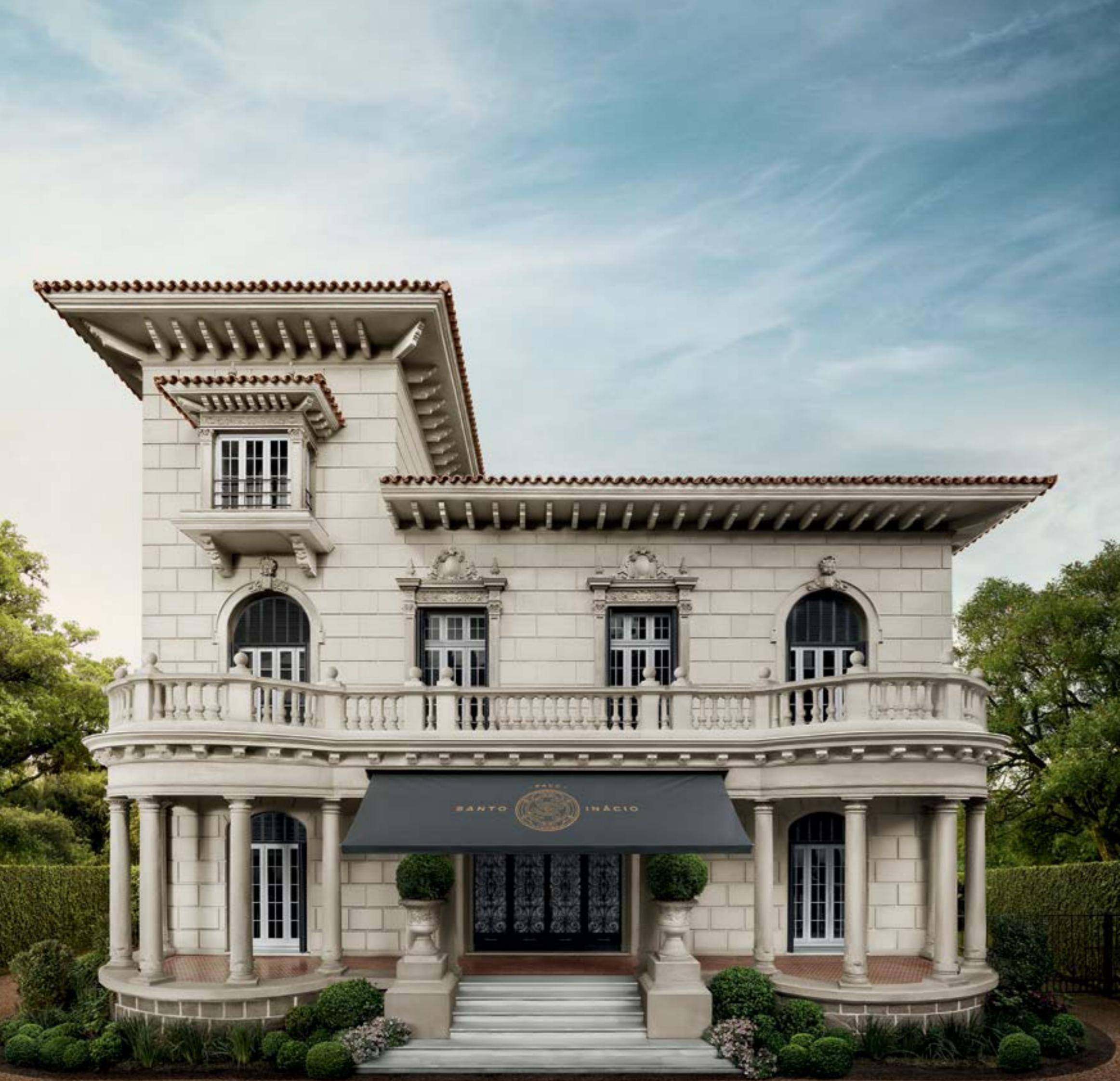
Foto ilustrativa da casa restaurada.