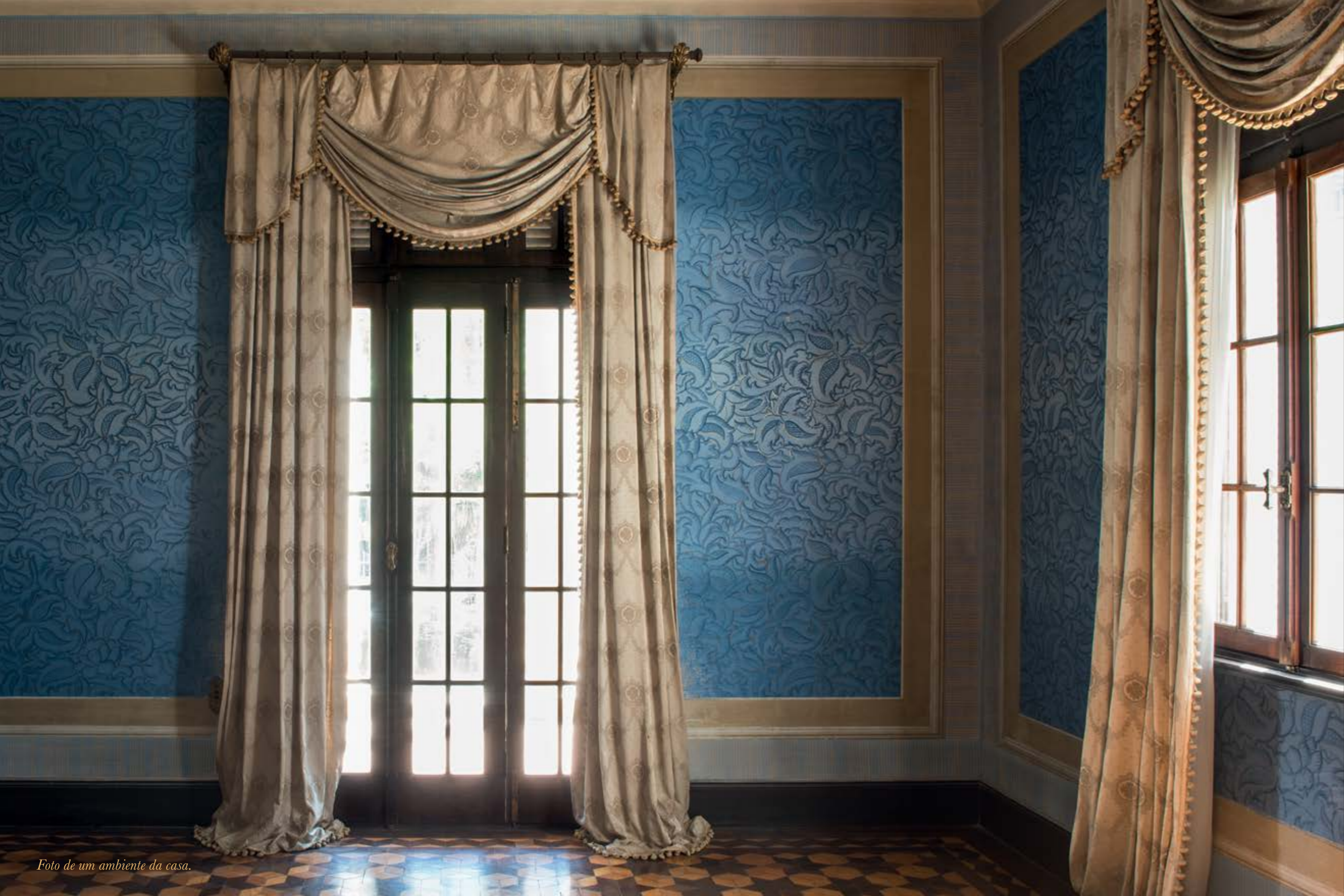
Foto de um ambiente da casa.