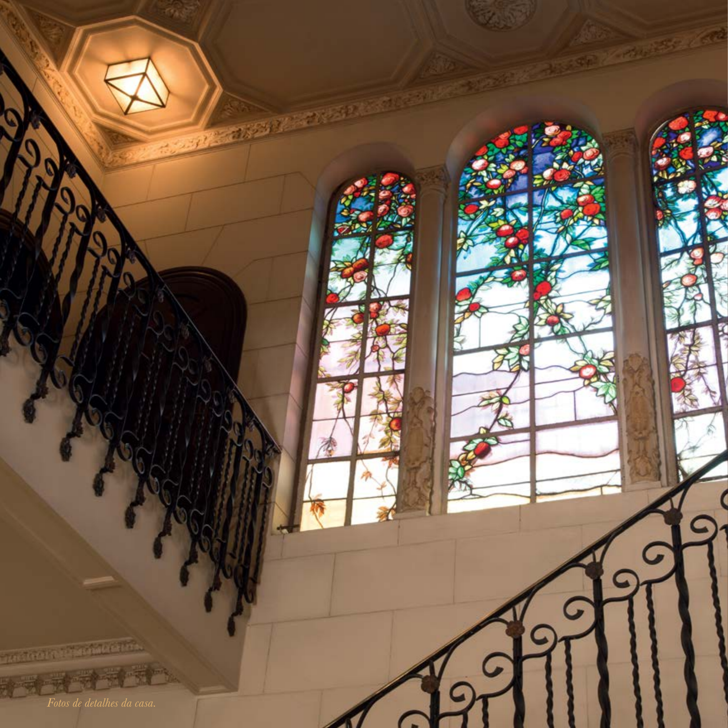
Fotos de detalhes da casa.