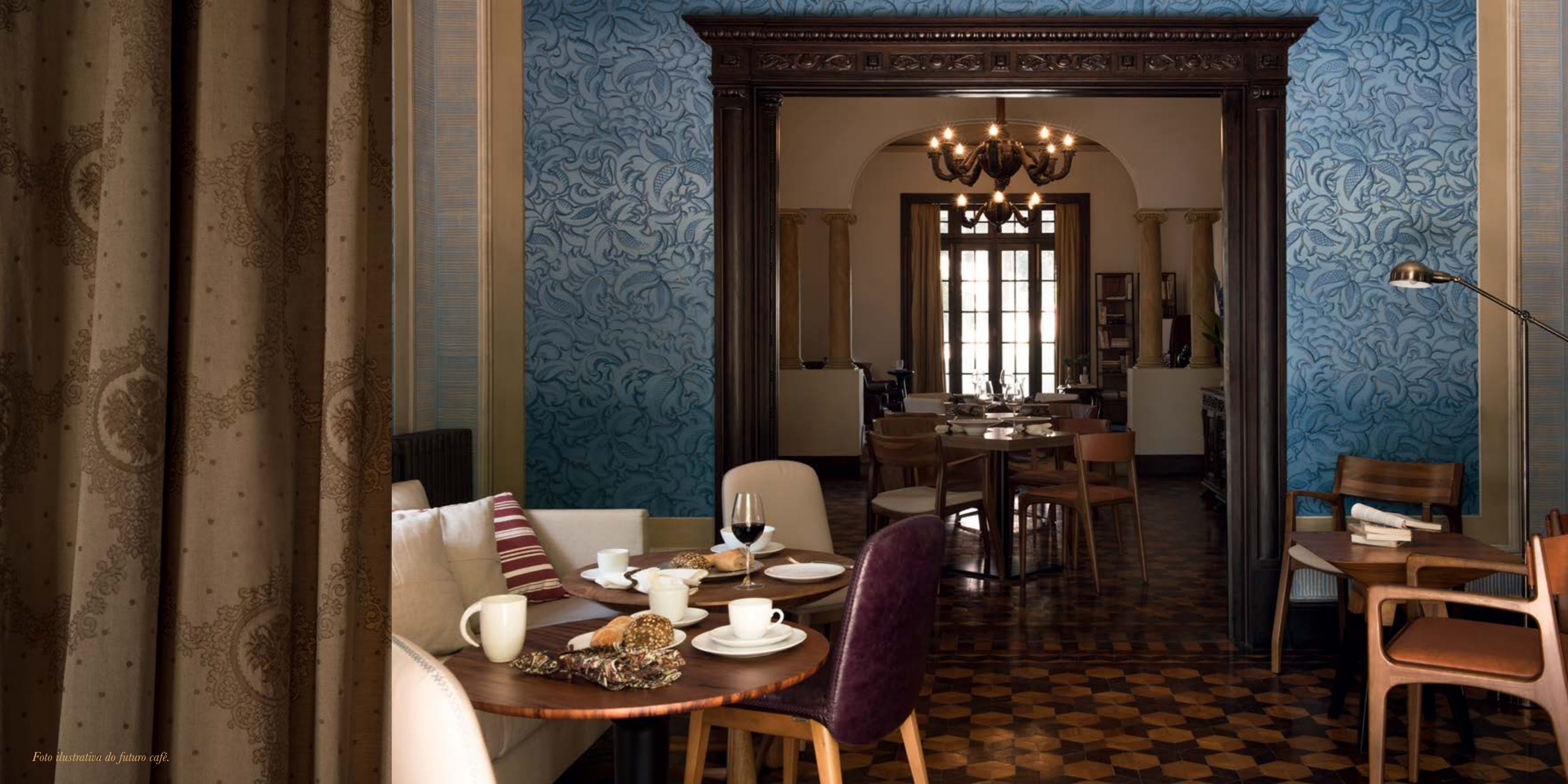
Foto ilustrativa do futuro café.