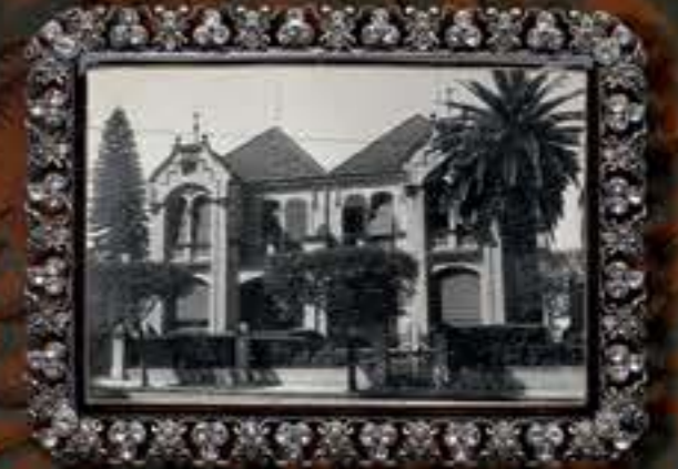
Foto ilustrativa do futuro memorial fotográfico.