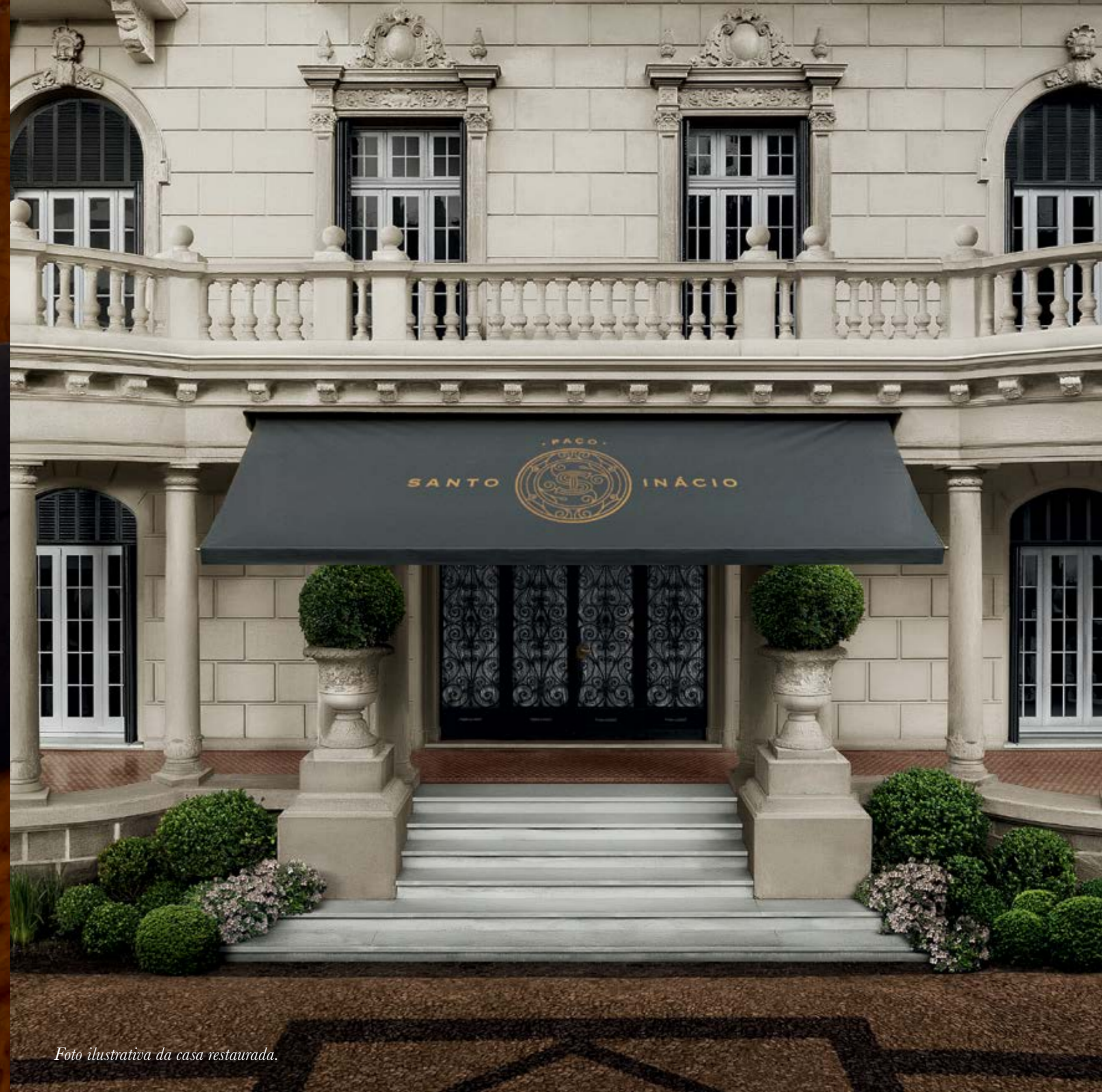
Foto ilustrativa da casa restaurada.