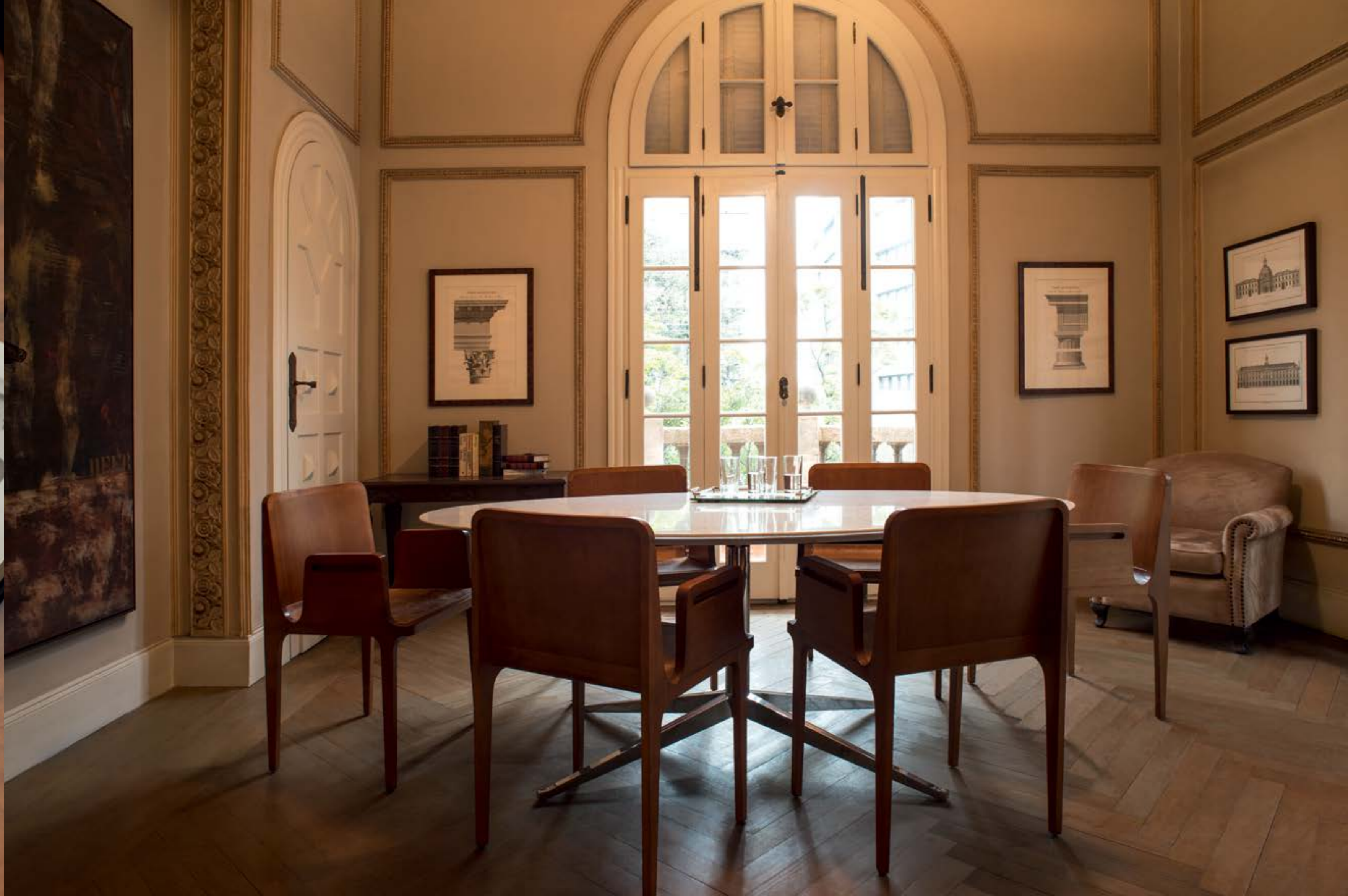
Foto ilustrativa de uma das futuras salas de reuniões.