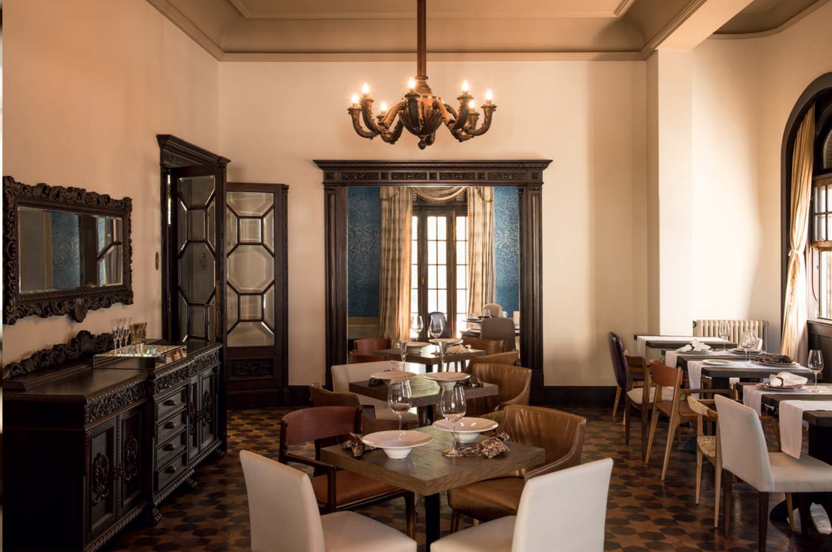
Foto ilustrativa do futuro bistrô.