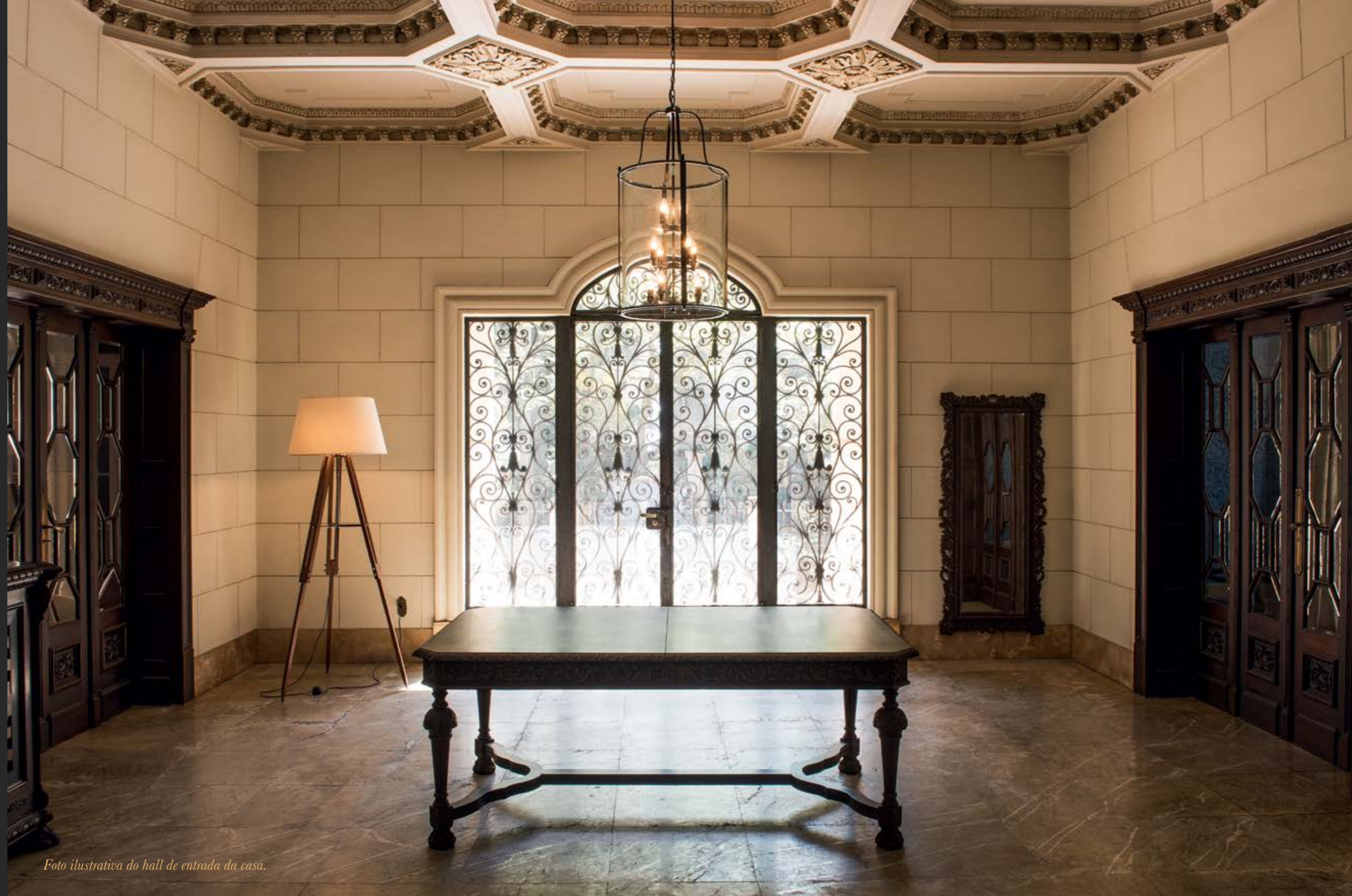
Foto ilustrativa do hall de entrada da casa.

Através de um criterioso projeto de preservação e restauração, a casa ganhará uma nova vida e será aberta à comunidade. O Paço Santo Inácio abrigará um charmoso café bistrô, salas de reuniões, uma sala de exposições e um memorial fotográfico com relatos sobre o Moinhos de Vento e também sobre a história da casa. Todo o projeto de decoração foi pensado para que não se percam as características de uma mansão de família. Assim, os visitantes terão uma experiência mais verdadeira, enquanto os moradores do prédio residencial poderão sentir o espaço como uma extensão de suas casas.