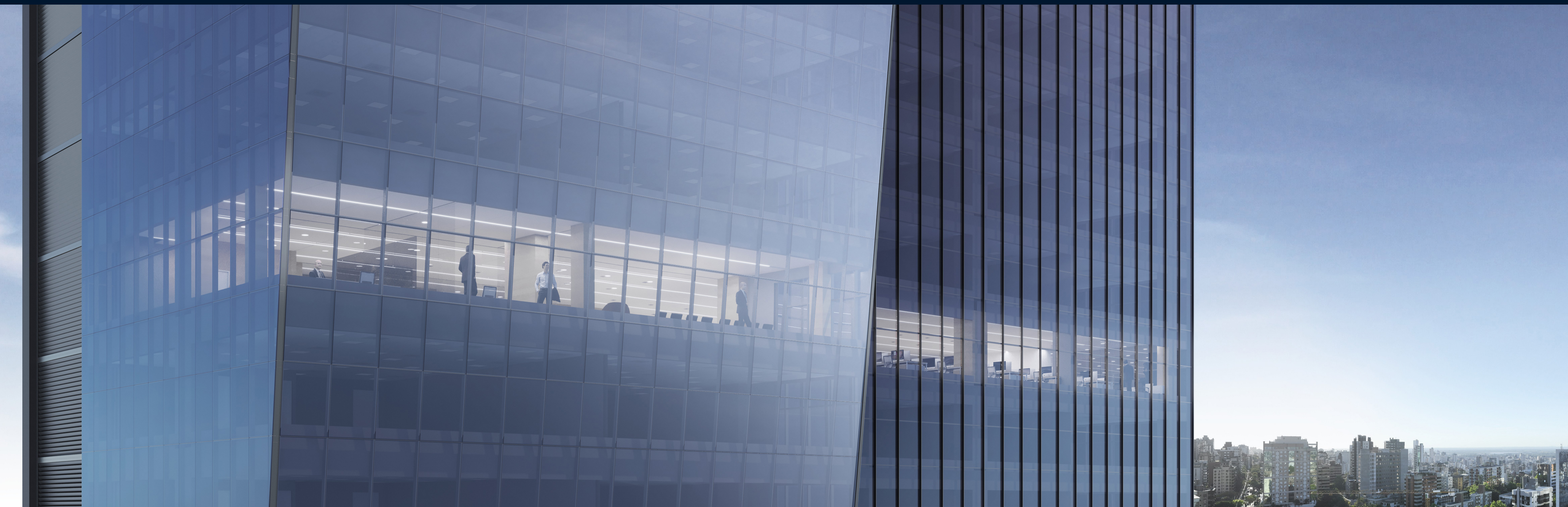
IMAGEM OPÇÃO LAJE CORPORATIVA.