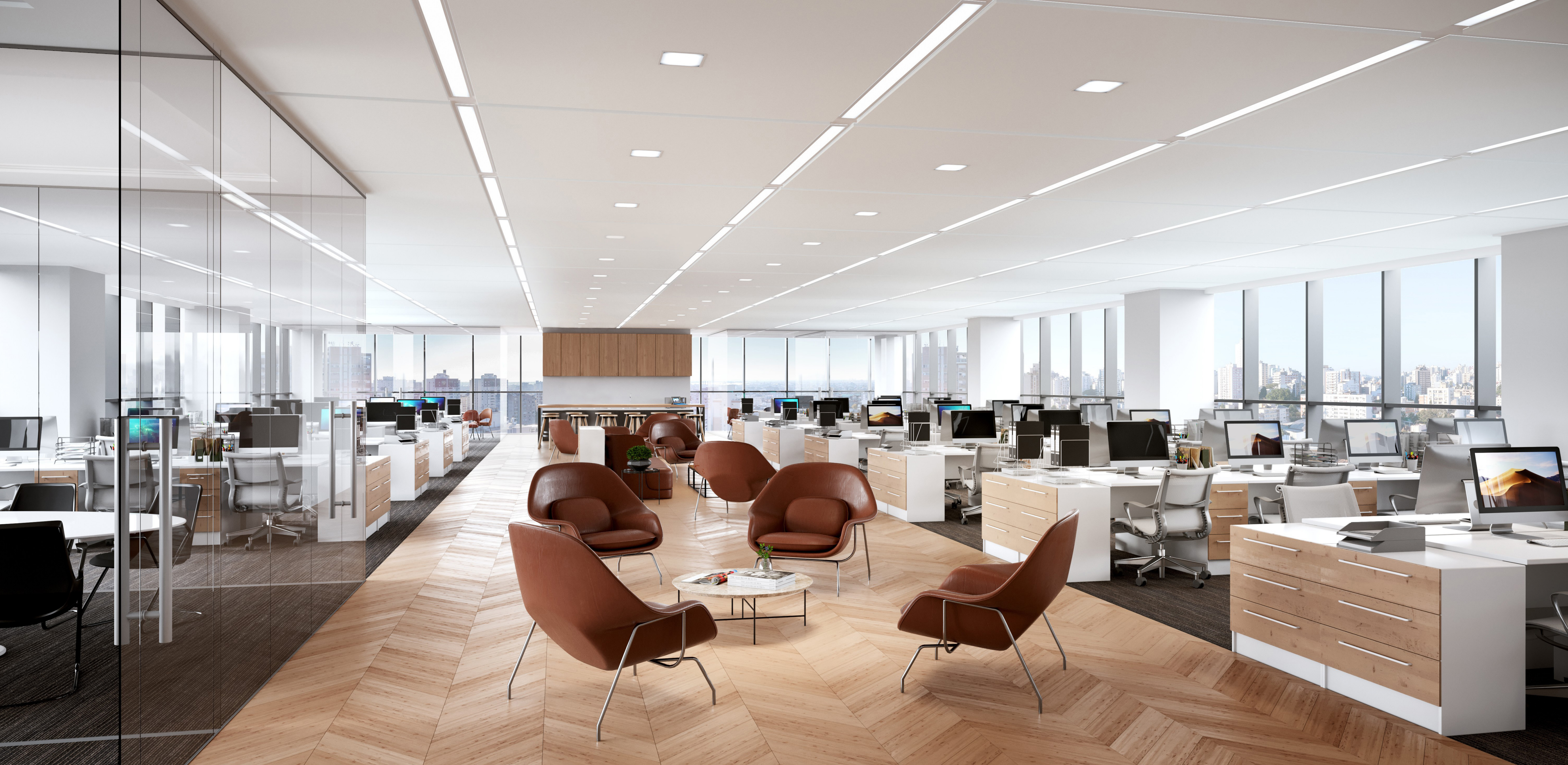
IMAGEM OPÇÃO MEIO ANDAR.