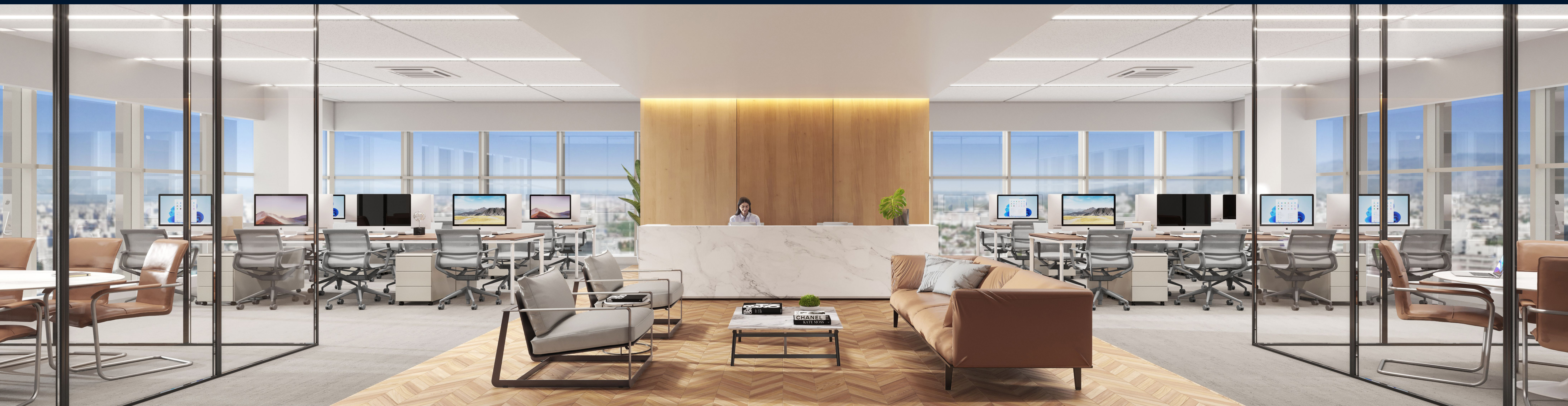
IMAGEM OPÇÃO UNIFICAÇÃO DE DUAS SALAS.